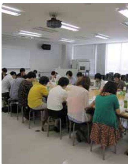
◀▲外来看護師・スタッフとの定期的なミーティングの様子と、家族に子どもが受ける処置や子どもを認めることの大切さを伝えるためのツール（一部）。