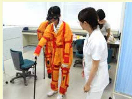
▲看護学体験コーナー