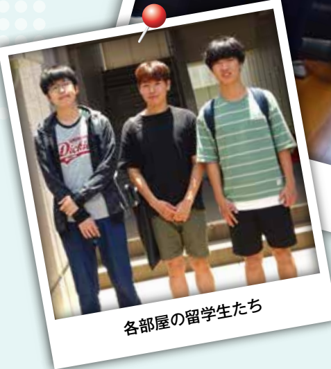
各部屋の留学生たち