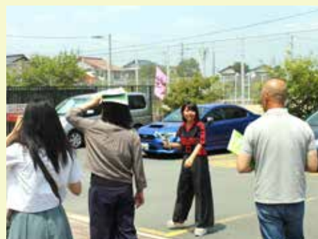
▲キャンパスツアーコーナー

平成30年8月4日(土)に夏のオープンキャンパスを開催いたしました。今回のオープンキャンパスには炎天下にもかかわらず、1,589名の方に足を運んでいただきました。来場者は県内にとどまらず九州各県、全国各地から参加された方がおられました。