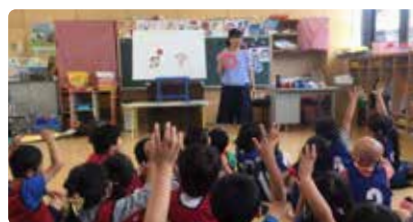
▲猛暑が来る前に、熱中症予防の「健康教育」を行っている様子。