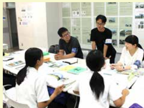
▲在学生と話そうコーナー