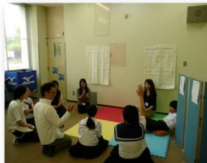
< グループワーク活動 >