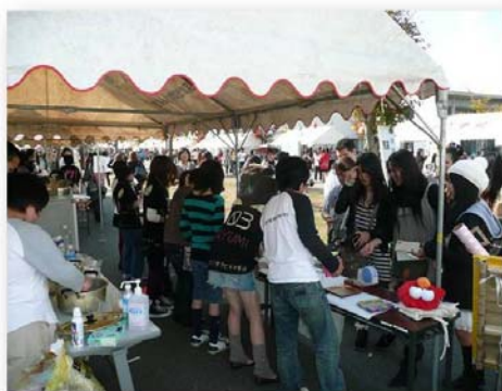
< 大学生との大学祭活動 >