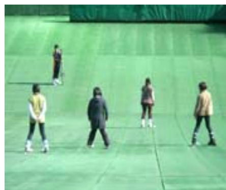
< 学外活動 >