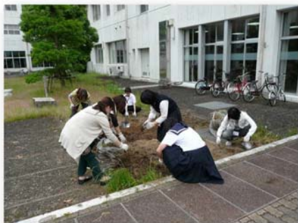
< 野菜の栽培活動 >