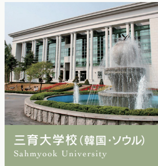
三育大(韓国・ソウル) Sahmyook University

* 留学中は協定校の学生寮に滞在可能です! * 月2万円の支援費を受けることができます!