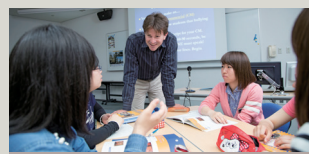
スキルアップゼミ

「アカデミック・ライティング」「ディスカッション」など1つのテーマについて短期集中で学びます。