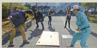
アジア文化交流会

学生の中には、JICAフィールド・スタディー・プログラムや福岡県青年の翼に参加した人もいます。