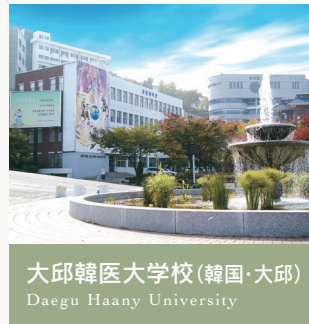
大邱韓医大(韓国・大邱) Daegu Haany University